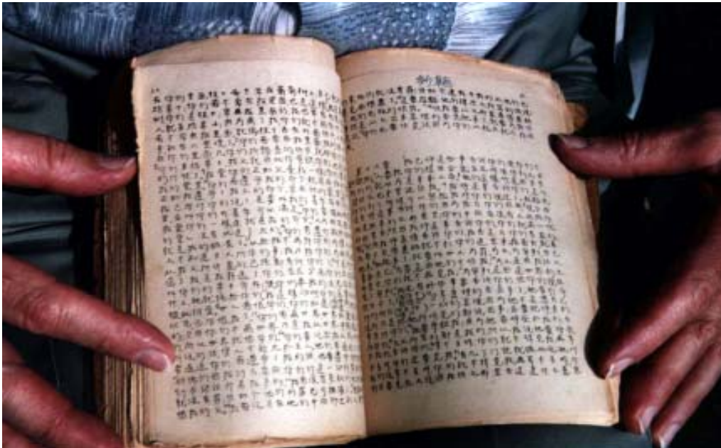
Una copia de la Biblia China hecha a mano de los años 70's

Cuando por primera vez conocí del Señor en 1974, estaba tan ansioso de leer la Palabra de Dios que oraba y ayunaba por 100 días, comiendo tan solo una pequeña ración de arroz diaria. Mis padres pensaban que había enloquecido por desesperación y ansiedad, pero finalmente de una manera milagrosa el Señor proveyó